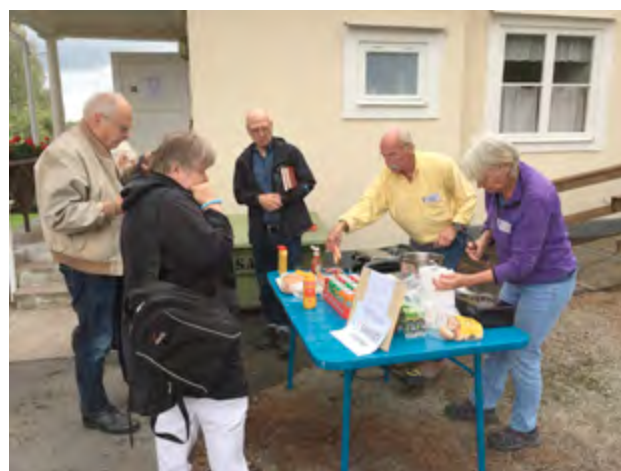
Lite bilder från Höstmarknaden