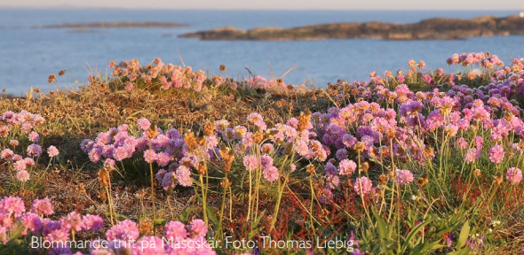
Blommående trift på Måseskär.