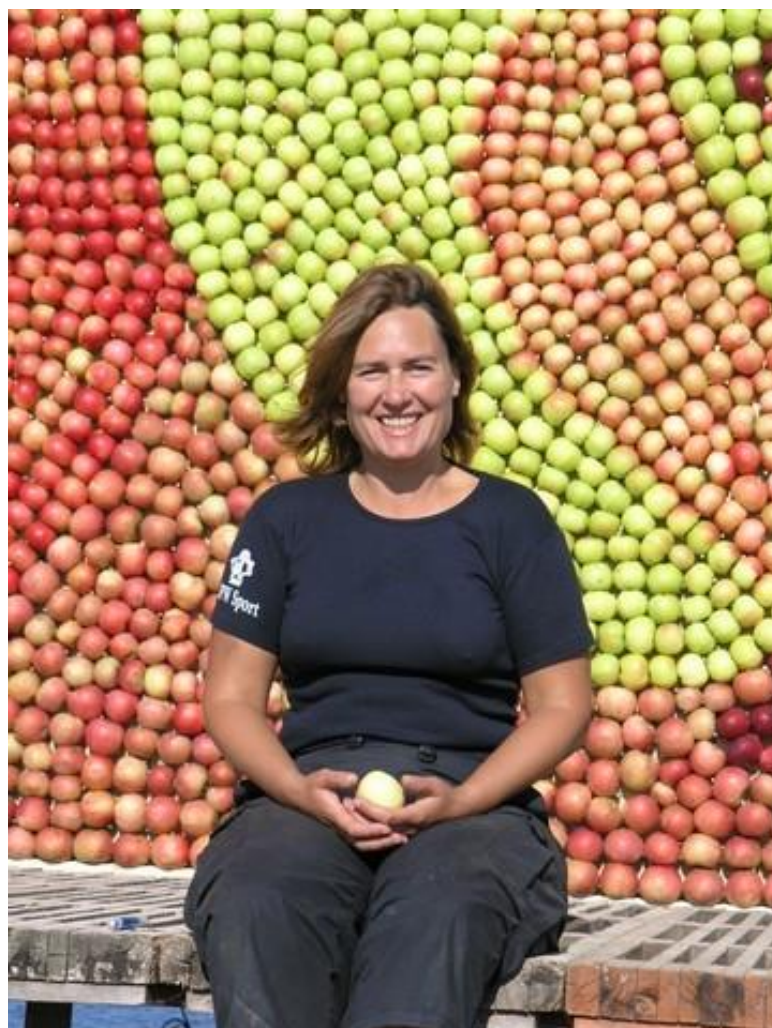
Detalj av äppeltavla från 2006