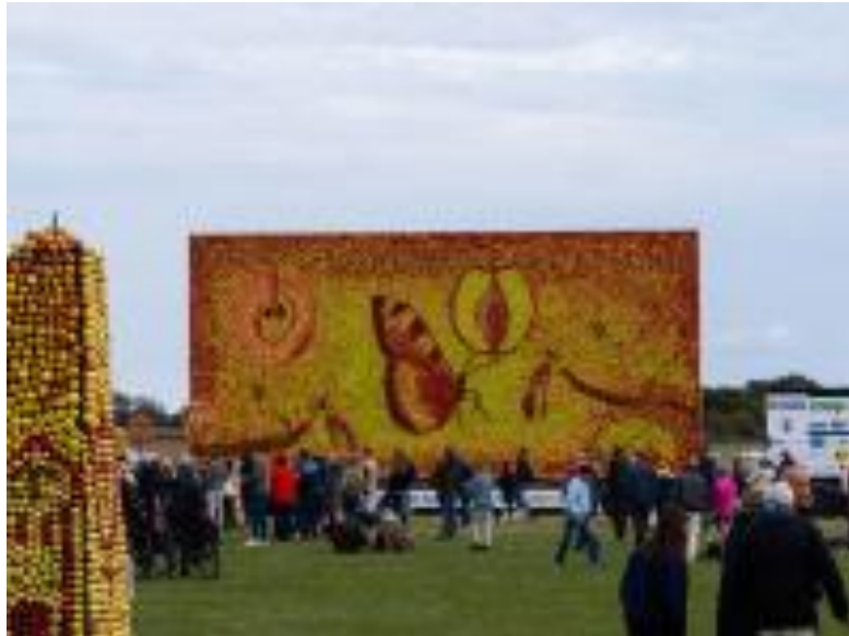
Äppeltaval från 2006

13.15 kommer vi till äppelmarknaden på Svabesholms Kungsgård strax söder Kivik där vi kan beskåda den enorma tavlan som består av drygt 30 000 äpplen och som invigs lördagen den 19 september, vilket är äppelmarknadens höjdpunkt. Det finns dock lite marknad kvar under mellanveckan, där vi får en kort stund före avresan 14.00 mot Kiviks hamn. Läs mer