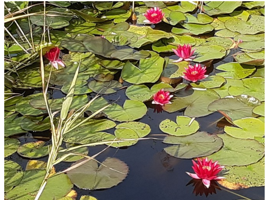
Röda näckrosor på Harstena, från utflykten 2021