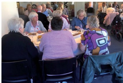
Lunch i Stora Hotellet i Örebro.