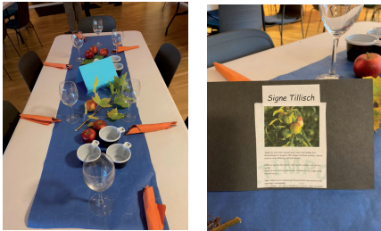
Fint dukat med bordsplaceringar.

Det serverades en rejäl och mycket god ost-skinka-broccoli-paj med