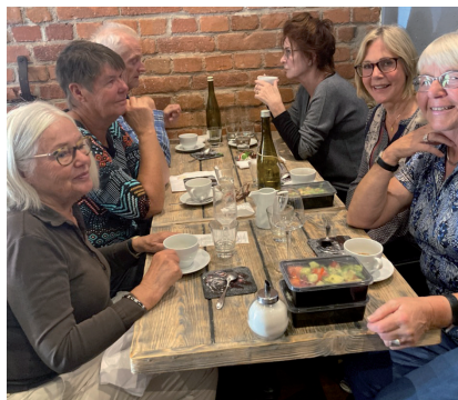
Höststart på Bra Mat.

Lunchpatrullen fortsätter att beta av Sundbybergs restauranger.