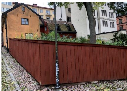
Bild från en av stadsvandringarna på Södermalm.