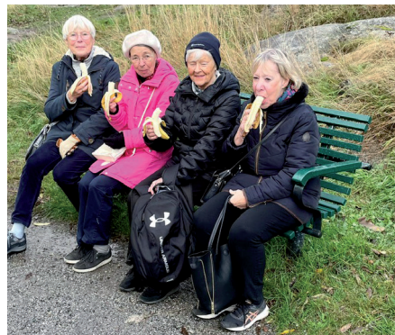
Fruktstund på Skinnarviksberget.

Den 18 oktober utforskades Mariaberget och alla dess 1700-talshus, som vi kunde beskåda in på gårdarna, och gamla fabriker som funnits där. Mycket kullersten att ta sig fram på!