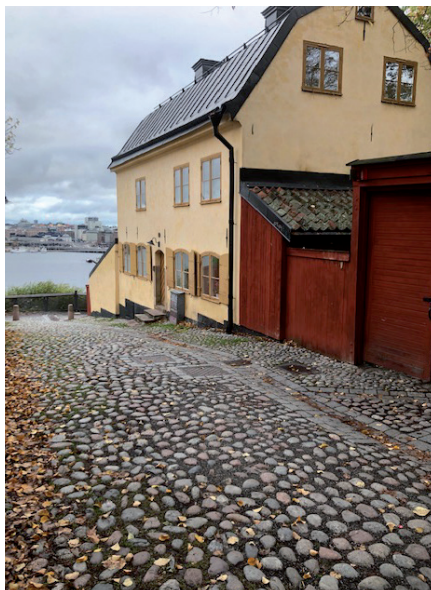
Mycket kullersten på 1700-talet – inget för höglackat...

berget, med sina 53 m över havet den högsta naturliga punkten innanför Stockholms tullar, som stod på tur.