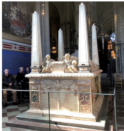
Här vilar Gustav Vasa med sina tre fruar.