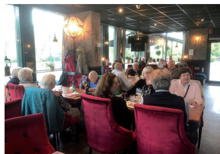
Lunch i Dolms kök.