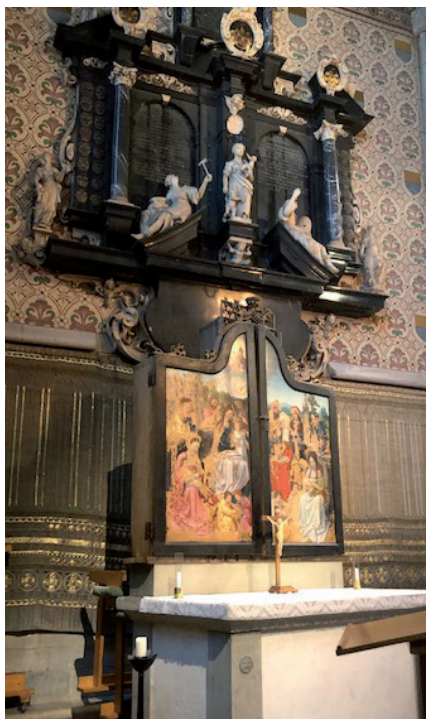
Kyrkans enda altarskåp, stängt p g a Stilla veckan.