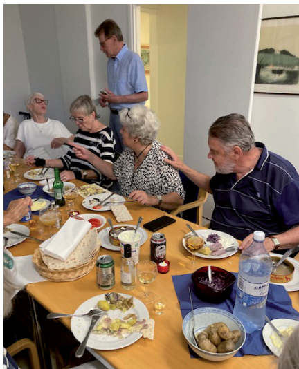
Höstens höjdpunkt, surströmming.

Vi försökte oss på några snapsvisor också, men det lät inte så bra denna gång tycker