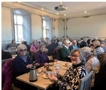
Guldrummet i Katedralkaféet.