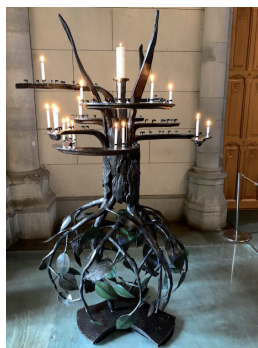
Ljusbäraren "Folkförföringens träd", tillverkad 2012.

Kyrkan består av många små gravkor, varav en del bekostats av prominenta, välbärgade personer, ofta med anknytning till järnbruken i närområdet. (Priset på järn var lika högt som