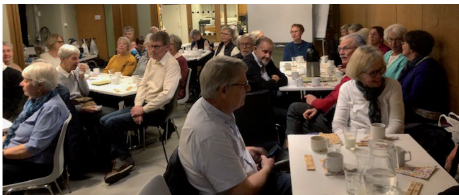
Fikastund efter träffen.