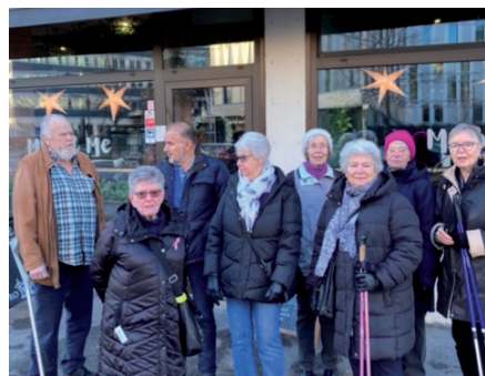
Patrullen bildar kö i väntan på lunch.