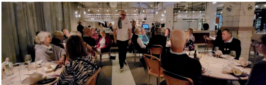
Interiör från restaurang AG.