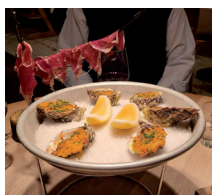
Ovan: Varmrätt olika sorters kött, kalvfärsfrikadeller i tomatås. Till vänster: Pata Negra-skinka och ostron Rockefeller.