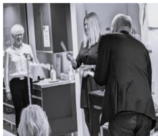
Bilder från invigningen

Så var det äntligen dags att slå upp portarna till de nya inspirationsrummen i Norrvikens träffpunkt med adress Sjöängsvägen 21 i Norrviken. Uppemot 50 personer hade samlats för att mingla och vara med om invigningen som pågick i dagarna tre. Ett av rummen har fokus på smarta prylar som gör din vardag lättare. Det andra rummet drivs i samarbete med SeniorNet Sollentuna med fokus att utbilda och tipsa om digital teknik som gör ditt liv enklare och roligare. Sök på kommunens hemsida: www.sollentuna.se efter träffpunkter så hittar du mer information om öppettider mm. SeniorNet Sollentunas schema hittar på deras hemsida: seniornetsollentuna.se