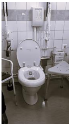
Toastol med skölj & tork