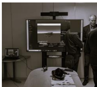
SeniorNet visar smart teknik