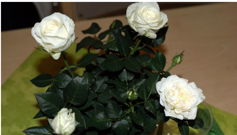
som tidigare hade smyckat borden.