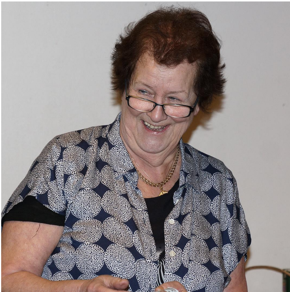
när de fick överlämna de vackra rosenbuskarna