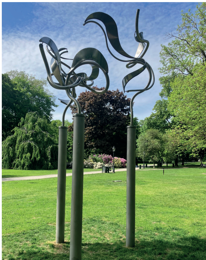
A Essle Zeiss / L Isaksson Lundin, Standing waves , 2022. Visas i Humlegården.

Mötesplats: Gasverkstorget, utanför Spårvägmuseet.