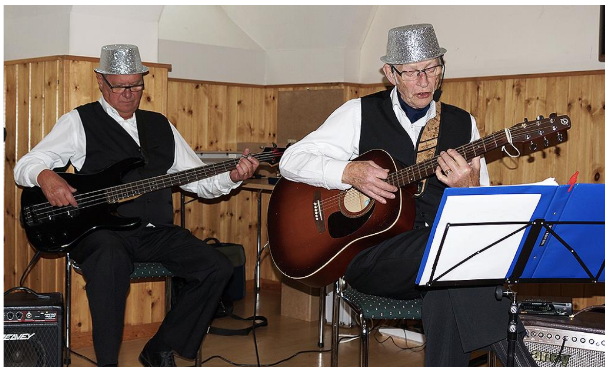
2 glada spelmän