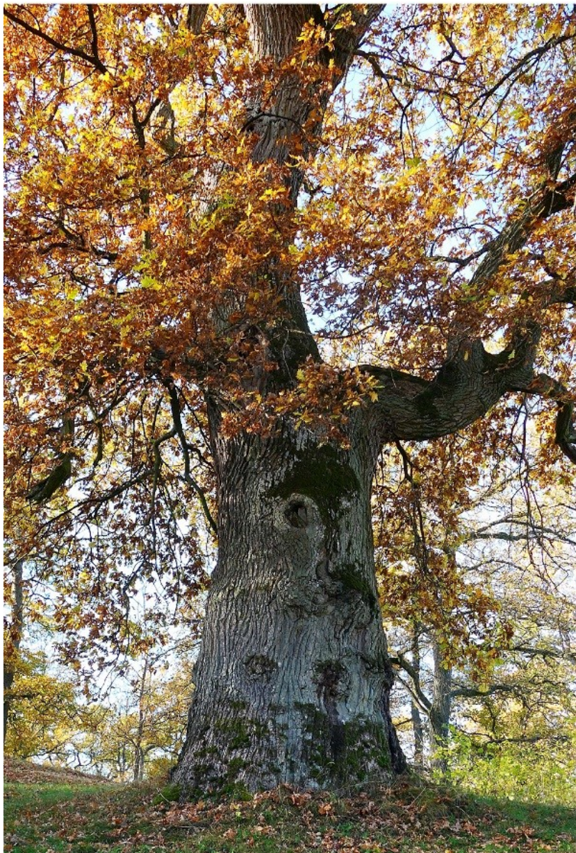
Eken i Viby står på huvudet.

POSTTIDNING B SPF Seniorerna Tunasol Box 834, 191 28 Sollentuna