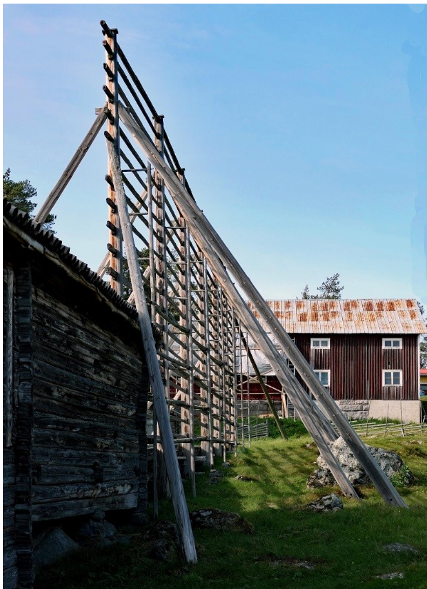
Längtan till gamla tider.

POSTTIDNING B SPF Seniorerna Tunasol Box 834, 191 28 Sollentuna