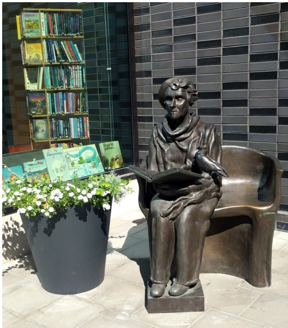
Astrid Lindgren vid nya KS entré.

POSTTIDNING B SPF Seniorerna Tunasol Box 834, 191 28 Sollentuna