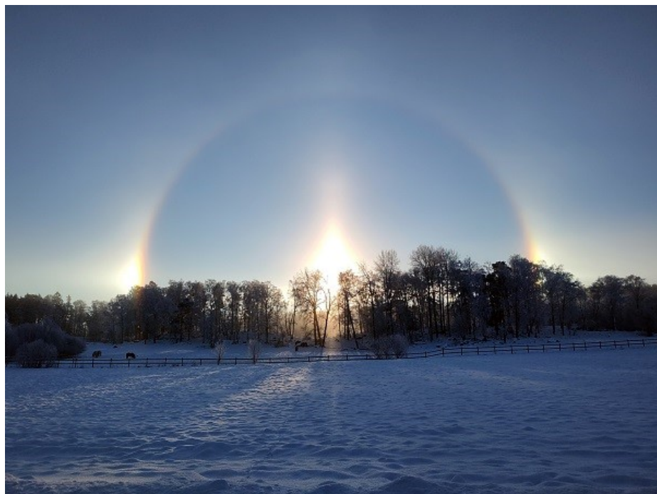
Natarufenomen på Bögs gård 2022-12-16.