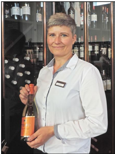
Vår guide Nordic Sea Winery