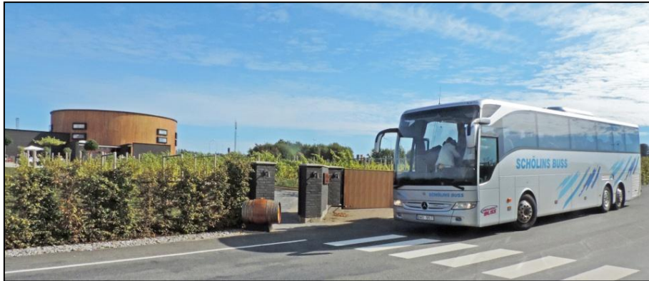
Vår buss utanför Nordic Sea Winery

När vi kom till Ystad och Cineteket möttes vi av en mycket trevlig guide. Efter att vi vandrat runt i det intressanta museet blev det kaffe och Wallanderbakelse i en av filmstudiorna.