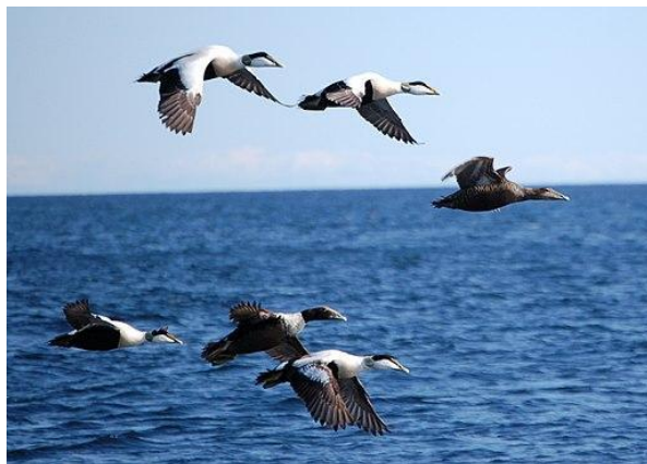
Ejder.