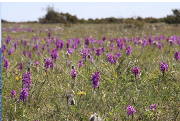
St Pers nycklar